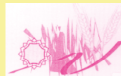
O.T.I. des Bords du Rhin

19h Attribution du Prix de Fessenheim à la meilleure toile à la salle polyvalente et du prix du meilleur stand offert par Karsenty Consulting.